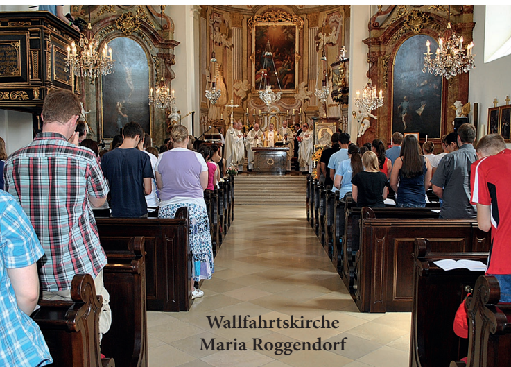
Wallfahrtskirche Maria Roggendorf